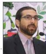
του Δρ. Αλέξανδρου Αντωνορά Επίκουρος Καθηγητής, Πανεπιστημίου Λευκωσίας, Πρόεδρος CSR Cyprus

Τον Σεπτέμβριο του 2015 υιοθετήθηκε από τα 193 κράτη μέλη των Ηνωμένων Εθνών ένα κοινό σχέδιο, η Ατζέντα 2030, για την επίτευξη ενός καλύτερου μέλλοντος για όλους, χαράσσοντας μια διαδρομή για τα επόμενα 15 χρόνια προς την εξάλειψη της ακραίας φτώχειας, την καταπολέμηση της ανισότητας και της αδικίας και την προστασία του Πλανήτη μας. Η Ατζέντα 2030 αποτελείται ουσιαστικά από 17 Στόχους Βιώσιμης Ανάπτυξης (ΣΒΑ) και 169 ειδικότερους που σχετίζονται άμεσα με αυτούς και αφορούν στις σημαντικότερες οικονομικές, κοινωνικές, περιβαλλοντικές και διακυβέρνησης προκλήσεις της εποχής μας. Οι ΣΒΑ ξεκάθαρα πλέον προσδιορίζουν την ατζέντα της ΕΚΕ για κάθε επιχείρηση και για την επίτευξή τους είναι αναγκαία η συνεργασία του επιχειρηματικού κόσμου με την πολιτεία και την κοινωνία των πολιτών.